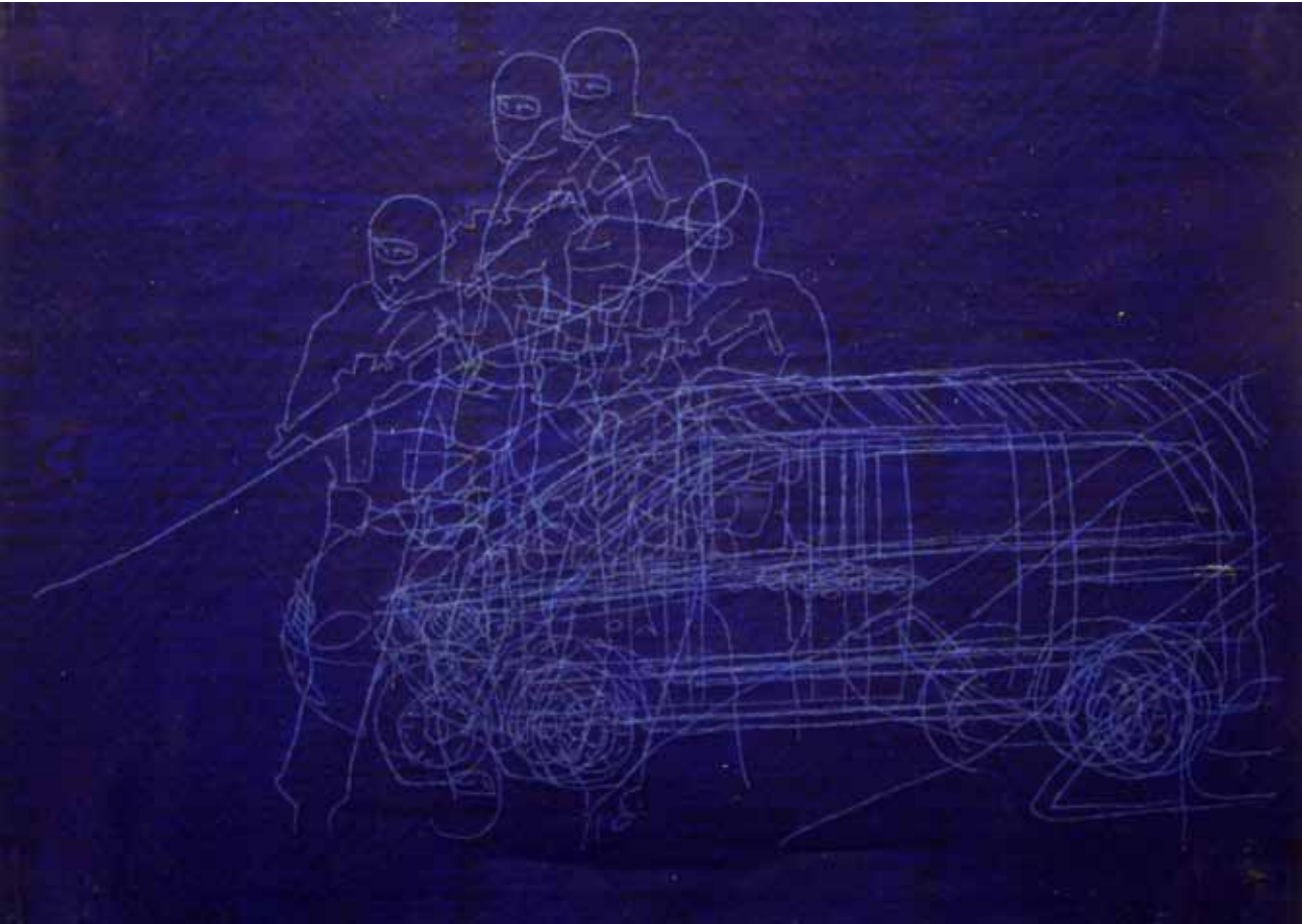
Crteži: Promjenjive dimenzije, monotipije 2012

2012 Akademija umjetnosti Minhen, Minhen - (Njemačka) 2012 Donumenta, Regensburg - (Njemačka) 2011 Gradski Muzej Ljubljana, Ljubljana - (Slovenija) 2011 53.Oktobarski Salon, Beograd - (Srbija) 2011 Nador Gallery, Pečuj - (Mađarska) 2008 ISCP, Njujork- (SAD) 2008 LMCC, Njujork - (SAD) 2008 “Fnac” Strazbur - (Francuska) 2006 “Real presence” - Beograd - (Srbija)