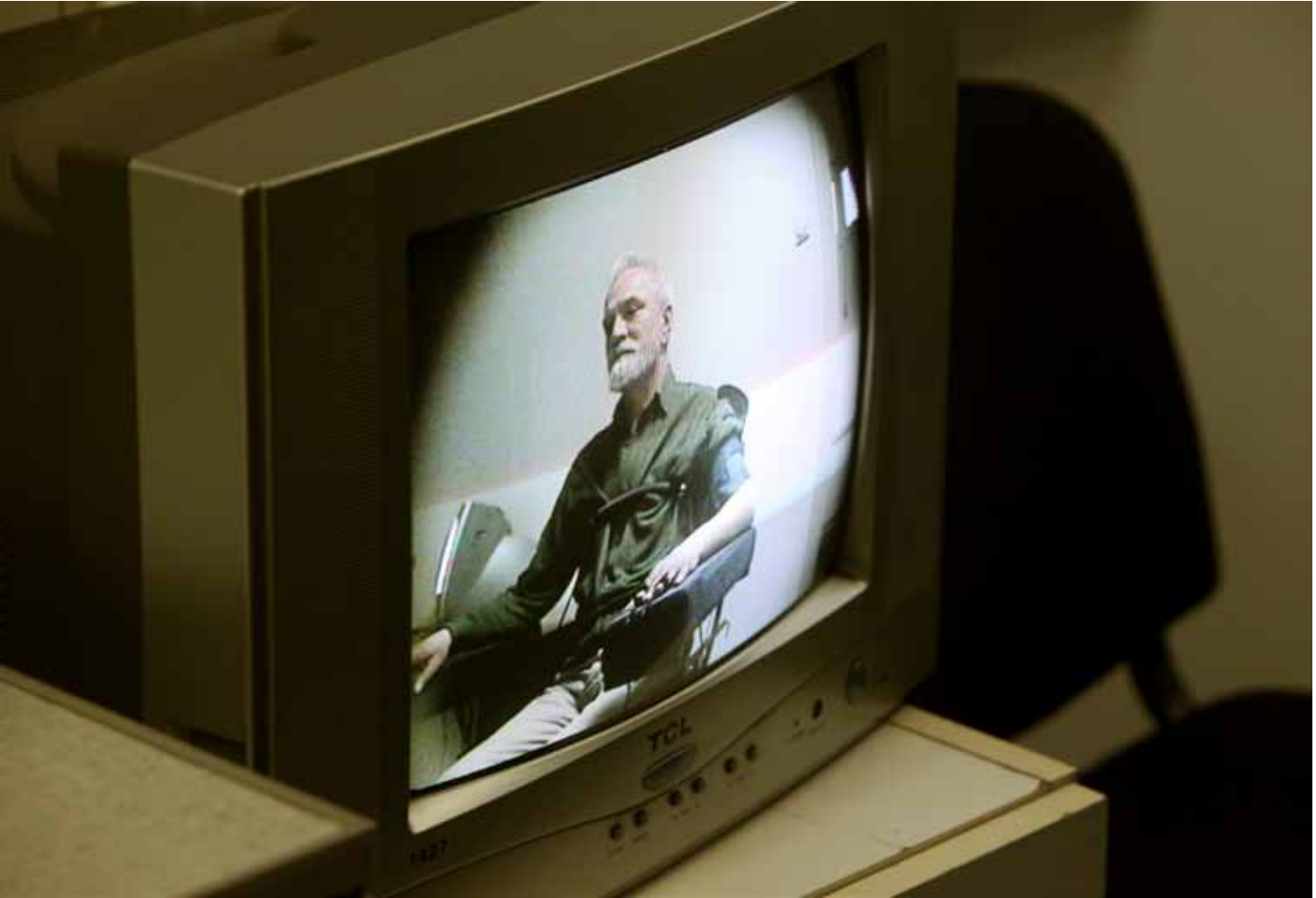
Film: DO YOU INTEND TO LIE TO ME? DA LI NAMJERAVATE DA ME LAŽETE? 14 min. HDV/DvD April 2011 Production/Produkcija: Academy of Arts Banja Luka, in cooperation with M-Quadrat Berlin/ Akademija umjetnosti Banja Luka u saradnji sa M-Quadrat Berlin